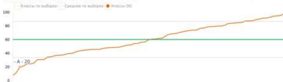
Форма 4. Распределение учащихся по уровням сформированности функциональной грамотности

средний процент по выборке 60, стандартное отклонение 26