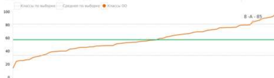
Форма 4. Распределение учащихся по уровням сформированности функциональной грамотности

средний процент по выборке 57, стандартное отклонение 24